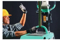
ユニックでの積み降ろしに便利な一点吊りフック